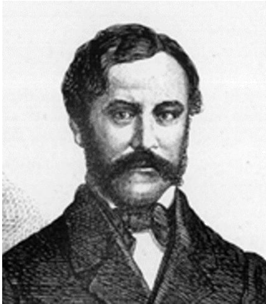
Stefano Castagnola (1825 – 1891)