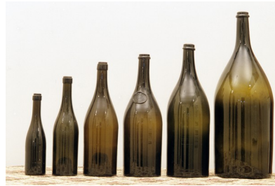
Malvasia di Trieste (1906, ib. 757)