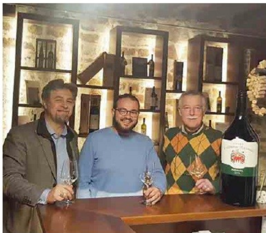
Tutto FIN / Cosma, dove e quando

L'Associazione è finalizzata alla promozione della conoscenza dei prodotti vitivinicoli ed agricoli dell'area del Mediterraneo con apposite azioni promozionali, di vigilanza, di collaborazioni con altre Associazioni ed Enti pubblici.