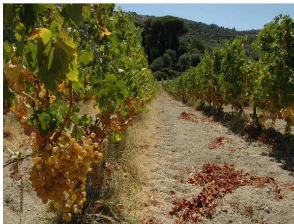
Tutto FIN / Cosma, dove e quando