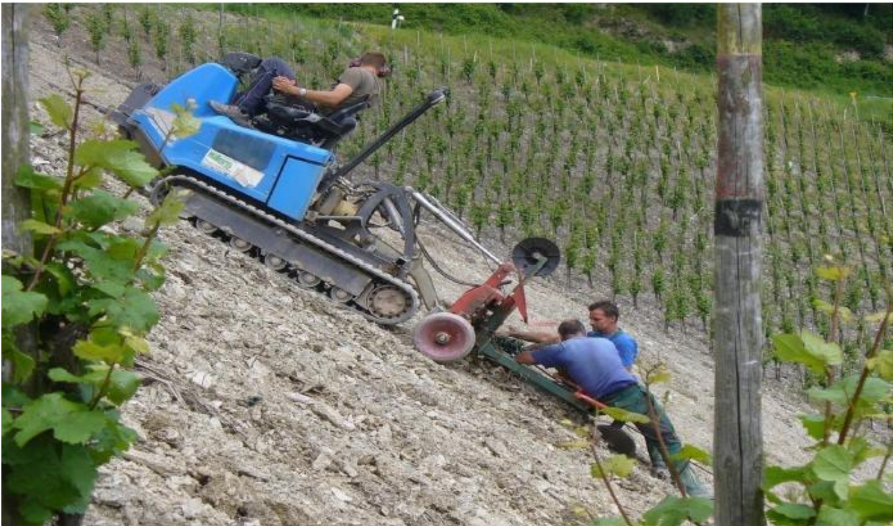
Figura 2: Sviluppo di macchine per le forti pendenze (Istituto di ricerca Geisenheim,, Germania)

L'altra tendenza è quella di coltivare la vite orizzontalmente creando dei piccoli terrazzamenti erbosi (banquettes), seguendo le curve di livello del terreno (fig.3). Nuove macchine sono state sviluppate per questo tipo particolare di coltura della vite in forte pendenza, come ad esempio delle macchine per alleggerire le scarpate. Nuovi metodi di conduzione con sdoppiamento dei piani vegetativi sono stati messi a punto per far fronte ad uno dei difetti di questo tipo di coltivazione in forte pendenza, sia la grande distanza tra le file.