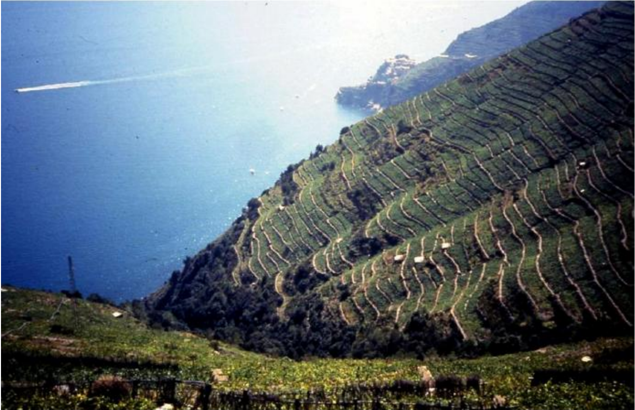
Figure 4 : Vigneti delle Cinque Terre (I) riconosciuti dall'UNESCO