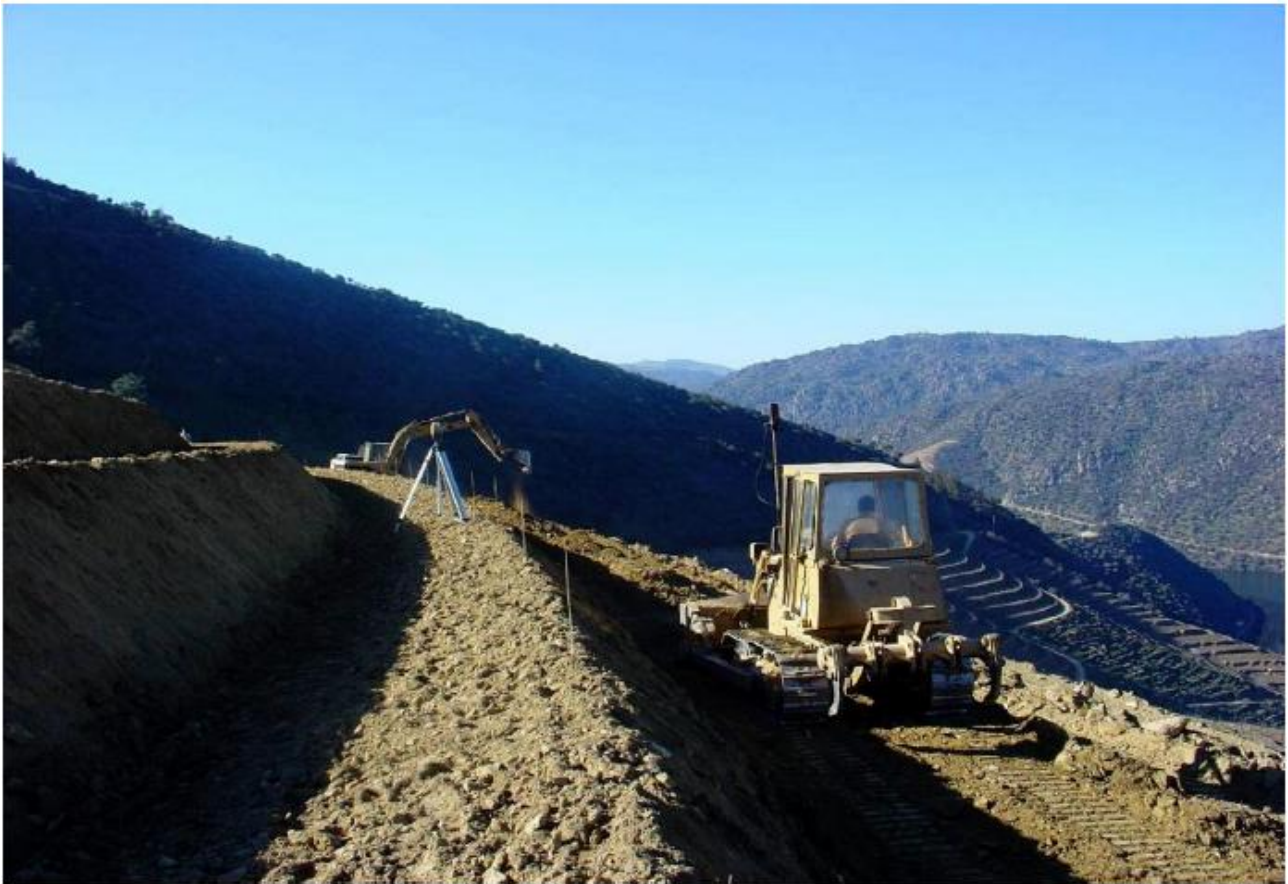
Figure 3 : Costruzione di piccole terrazze nei vigneti del Douro (Portogallo)

Il progresso dell'informatica rende attualmente possibile la ricerca di sistemi di meccanizzazione teleguidati, oggi ancora allo stadio di prototipo, che potrebbero rendere un enorme servizio in situazioni difficili. L'innovazione permette di rendere più attraente la professione del viticoltore e di interessare giovani produttori a praticare la viticoltura in zone di montagna e in forte pendenza.